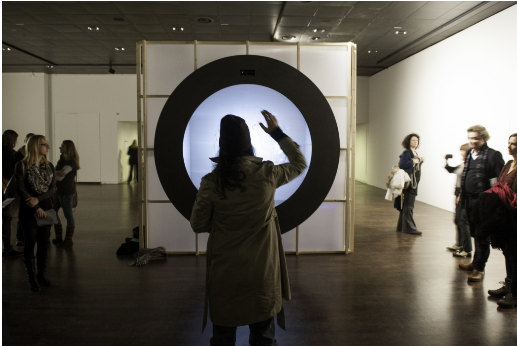
BesucherInnen bei der Eröffnung