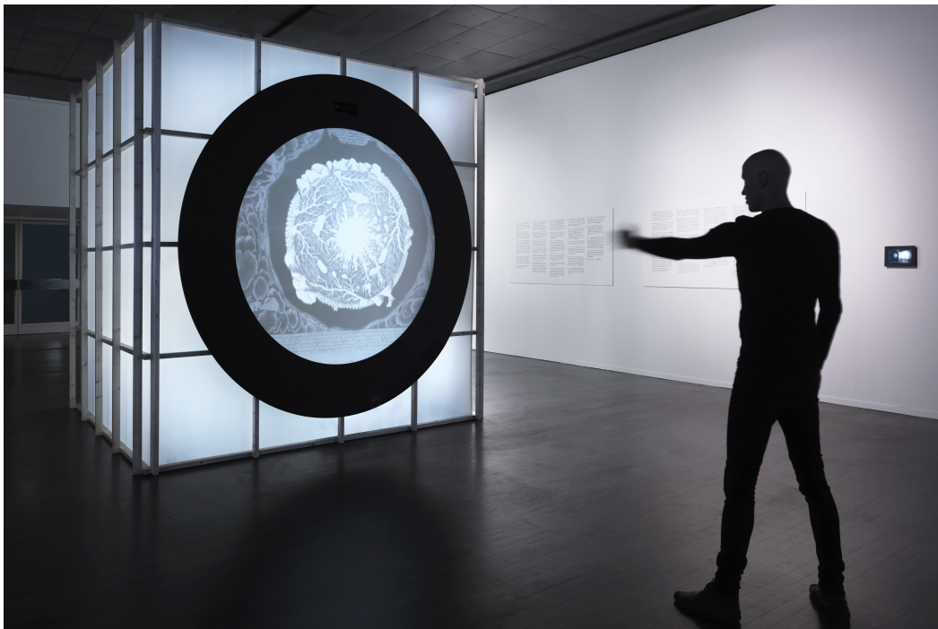
Installationsansicht „Gedankenscherz“, Foto: Jens Ziehe

Die präsentierten Texte sind unabhängige AutorInnentexte und geben nicht in jedem Fall die Meinung des Humboldt Lab Dahlem wieder. Die Rechte liegen, wenn nicht anders angegeben, beim Humboldt Lab Dahlem. Hinweis für die PDF-Druckversion: alle Links sind auf den entsprechenden Unterseiten von www.humboldt-lab.de abrufbar.