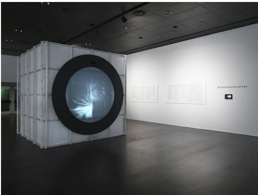
Installationsansicht „Gedankenscherz“, Foto: Jens Ziehe